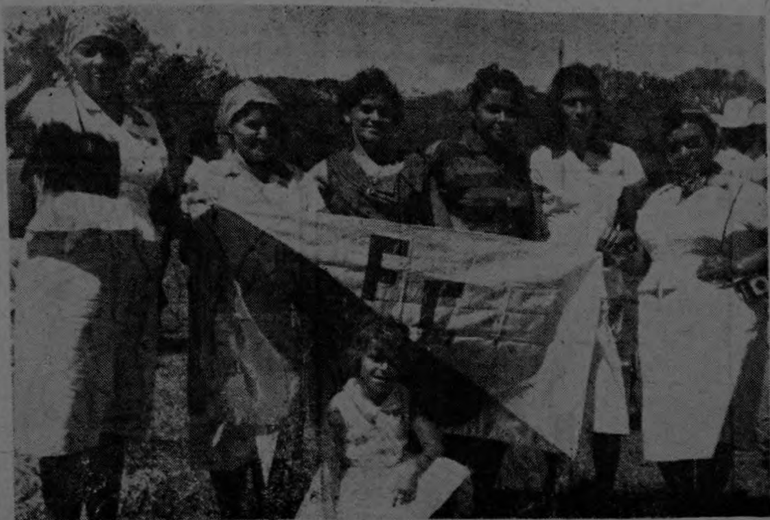
Factor determinante para el ánimo de los jugadores Ferrocarriileros en la cancha de Santa Cruz constituyó la presencia de su entusiasta y activa Ala Femenina. Aunque no todas tuvieron la oportunidad de viajar en la delegación, pero las pocas damas que asistieron, todas de un entusiasmo grande, ayudaron desde la línea de cal a sus valientes jugadores. Aquí las vemos poco antes de que Ferroviarios ganara su primer juego. Las felicitamos, pues la entidad busca la mejor manera de estimular a sus deportistas.