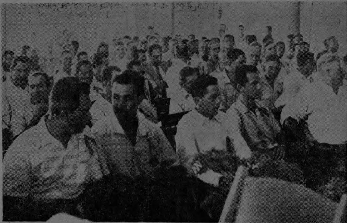
Grupo de ganaderos costarricenses, después de su recorrido por la zona bananera, en la magna Asamblea de la Cámara de Ganaderos de Chiriquí.